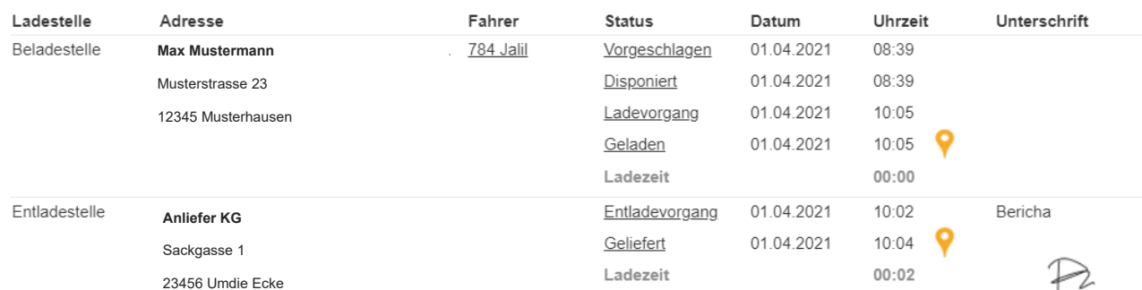
Foto: 784_784_01042021_100236.jpg | Löschen 784_784_01042021_100252.jpg | Löschen